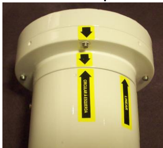
Circular à Esquerda