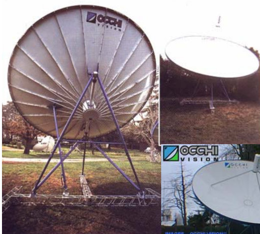
5,00 metros Polar