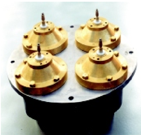
Chave Coaxial Vista Lateral