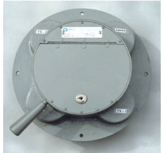
Chave Coaxial Vista Frontal

A Chave Coaxial da GOBER, é um projeto inovador, destaca-se pela maneira como são confeccionados os contatos de latão tipo mola, que não perdem a rigidez com o decorrer do tempo, podem ser fornecidas com micro swicht para desligar a alta tensão do TX por ocasião da mudança de posição. Sua principal finalidade é de colocar o TX principal ou reserva com carga, ou antena principal sem necessidade de troca de cabos.